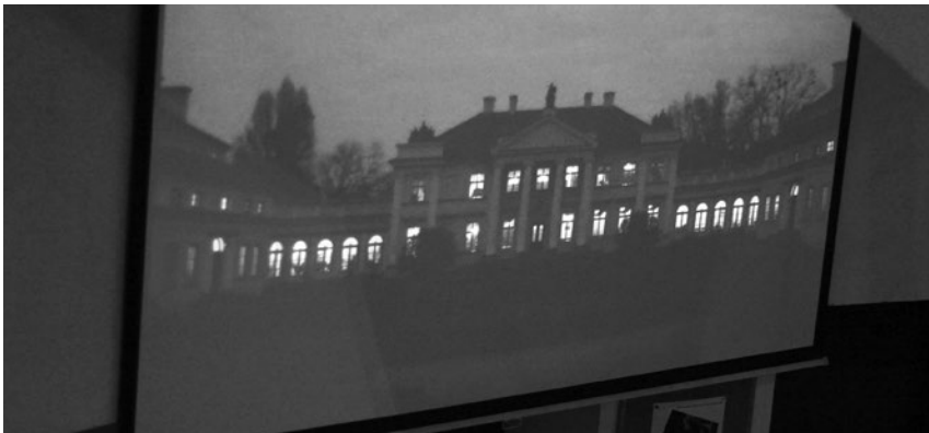
Natalia Wiśniewska, Niech żyje muzeum , 2015