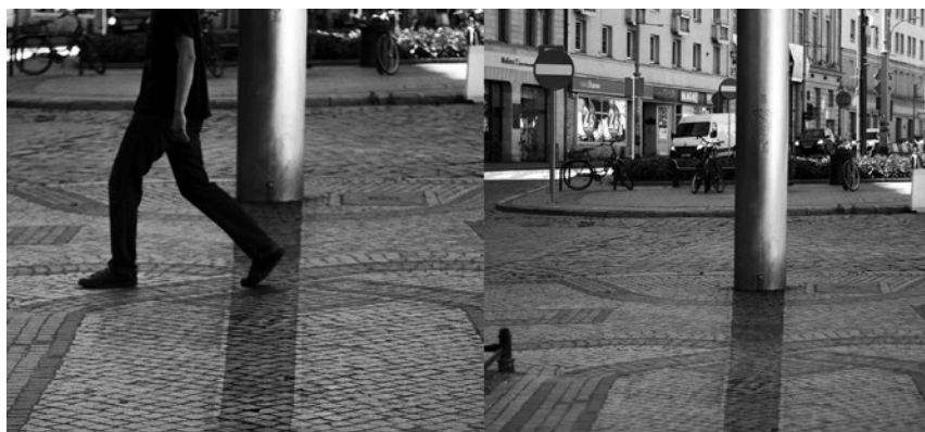
Maciej Kurak, Wędrujący cień , 2016