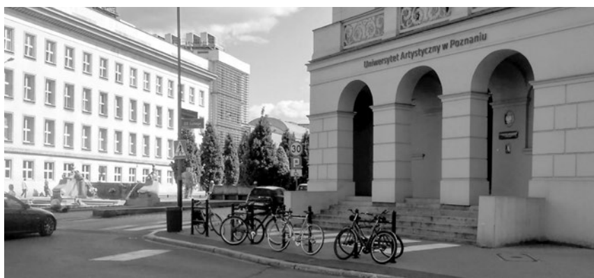
Piotr C. Kowalski, instalacja, 2016