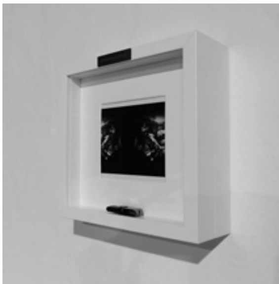
Il. 8. Rafał Boettner-Łubowski, À propos du ready-made (?) / Redefinicja przedmiotu , grafika cyfrowa (odbitka na papierze fotograficznym) / przedmiot cytowany / ramy-gabloty, 2018, fot. Rafał Boettner-Łubowski.

prezentacji quasi-muzealnej. Zaprojektowałem i zmontowałem zaskakujące w swoim oddziaływaniu „czysto” wizualnym „ekspozitory”, zbudowane z zastanych, brązowych galeryjnych postumentów oraz ustawionych na nich, w określonym porządku, czarnych kameralnych ekranów. „Ekspozitory” tego rodzaju zostały ustawione w sześciu miniprzestrzeniach, wyznaczonych przez drewniane elementy architektonicznego wnętrza cieszyńskiego poddasza, co zaakcentowało istotne rytmy w całości konstruowanej ekspozycji. Na wspomnianych „ekspozytorach” zostały pokazane prace Dąsy Lasotovej z serii Wyszywanki oraz moje malarsko-objektowe Redefinicje przedmiotów . Opisane formy ekspozycyjne kojarzyć się mogły