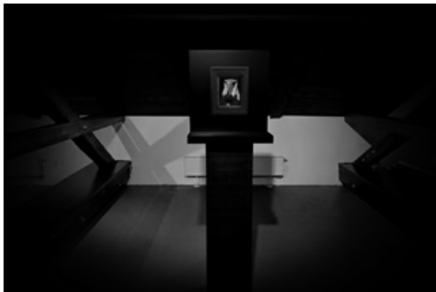
Il. 4. Dáša Lasotová, z serii Wyszywanki , strona z książki / elementy wyszywane, 2016, fot. Rafał Boettner-Łubowski.