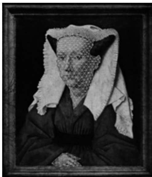
Il. 5. Dáša Lasotová, z serii Wyszywanki , strona z książki / elementy wyszywane, 2016, fot. archiwum Dášy Lasotovej.