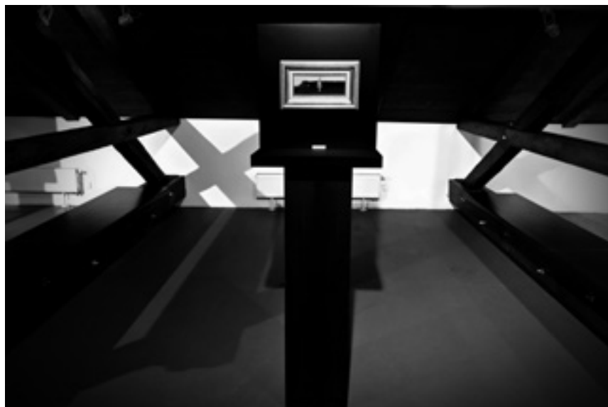
Il. 9. Rafał Boettner-Łubowski, Redefinicje przedmiotu III , akryl na płycie / retro-przedmioty / rama / czarny ekran, 2015, fot. Rafał Boettner-Łubowski.

zach oraz wspomniane wcześniej obiekty mojego autorstwa z serii À propos du ready-made (?) – zostały z kolei wyeksponowane na tle białych, szczytowych ścian pomieszczenia galeryjnego, dyskretnie wtapiając się w przestrzeń otoczenia. Opisanie powyżej rozstrzygnięcia ekspozycyjne nie stanowiły z całą pewnością rutynowych efektów działalności projektowej z dziedziny wystawiennictwa, lecz były raczej aktem wykreowania swoistej „instalacji” artystycznej, która odnosiła się do zastanej przestrzeni architektonicznej, ale dodatkowo wyznaczała relacje dialogiczne pomiędzy zaprezentowanymi na wystawie obiektami. Zauważył to podczas wernisażu wystawy Redefinicje i Reminiscencje wieloletni animator i kurator Gale-