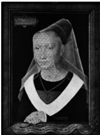
Il. 6. Dáša Lasotová, z serii Wyszywanki , strona z książki / elementy wyszywane, 2016.

we wnętrzu zabytkowej maszyny do szycia w obiekcie pt. Retro-Assemblage . Poza tym istotne stały się również nowe obiekty z 2018 roku, w których wykorzystują potencjał pamiątkowych gadżetów muzealnych lub motywów dawnej sztuki, konfrontując je ze starannie wybranymi, dodatkowymi ele-