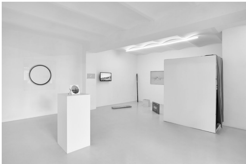
Widok wystawy Voyager's Record | Rejestr podróżnika , 2018

badaczy w szerokim tego słowa znaczeniu. Mogą oni wpływać na efekty prezentowane przez innych researchów, dodając własne uwagi i spostrzeżenia. Każde kolejne ruchy odbywają się dzięki interakcji z innym badaczem, co wyraźnie wpływa na wciąż rozwijającą się sieć. Finalny efekt projektu zależy od autora, który posługując się wypracowanym designem metodologicznym, prezentuje swoje badania publiczności.