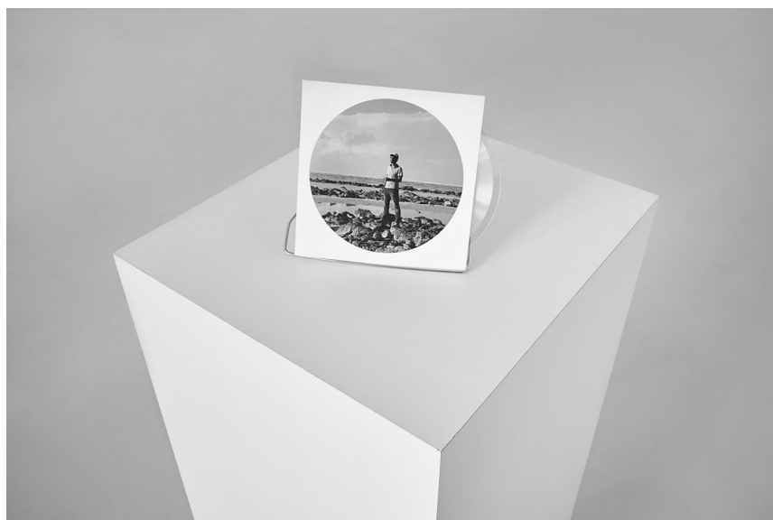
Łukasz Jastrubczak, Spacer po Spiralnej Grobli , płyta oraz rejestr dźwiękowy, 2015