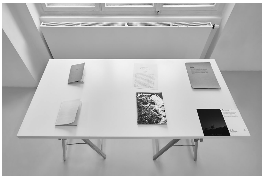
Widok wystawy Voyager's Record | Rejestr podróżnika , 2018

Istotnym elementem, który porządkuje ideę wystawy, stała się stworzona przeze mnie mapa koncepcyjna. Została ona zainspirowana estetyką dawnych rysunków przestrzeni kosmicznej. Kolejno powiększające się okręgi ukazują zjawisko rozwoju koncepcji kuratorskiej, która nie mogłaby funkcjonować bez złożonej siatki pojęć. To wokół nich orbituje konkretna wizja rzeczywistości.