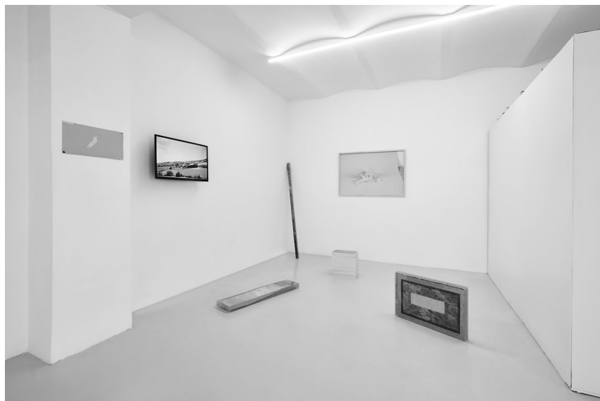
Widok wystawy Voyager's Record / Rejestr podróżnika , 2018

Wystawa The Voyager's Record/ Rejestr podróżnika odnosi się do podróży jako formy mobilności wynikającej z wewnętrznej potrzeby zobaczenia miejsc niedostępnych, nieodkrytych, zaginionych czy tajemniczych. Jej tytuł nawiązuje do nazwy dwóch połączonych dysków – The Voyager Golden Record – które zostały w latach 70. XX wieku umieszczone na pokładzie sond wystrzelonych przez NASA w ramach programu Voyager . Znajdowały się na nich nagrania oraz fotografie, które obrazowały potencjalnym pozaziemskim odbiorcom cykl życia ludzkiego gatunku na Ziemi.