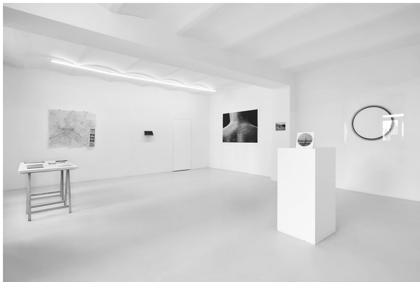
Widok wystawy Voyager's Record | Rejestr podróżnika , 2018