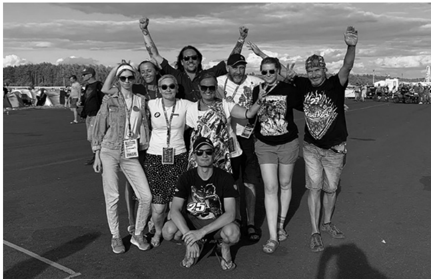
Reprezentacja UAP na Pol'and'Rock