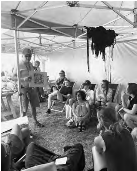
Fotografie z profilu Facebook, Uniwersytet Artystyczny na Pol'and'Rock