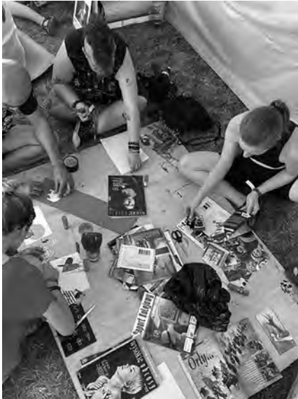
Fotografie z profilu Facebook, Uniwersytet Artystyczny na Pol'and'Rock