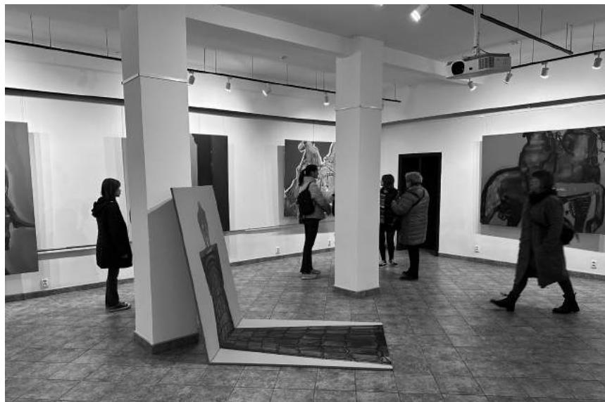
Nietrwały Znak, Jakub Malinowski

Nietrwały Znak, Jakub Malinowski (18.11–29.12)