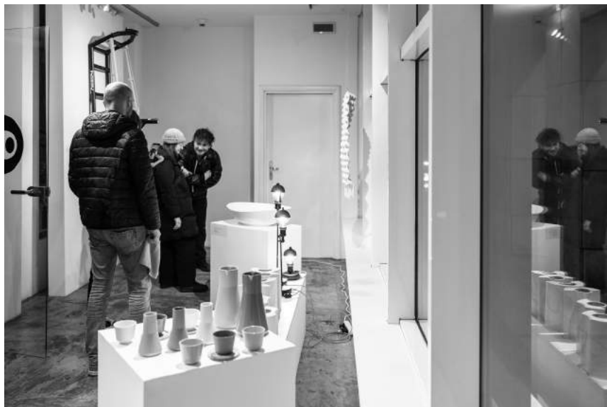
WDROŻENIOWO I STUDYJNIE_vol. 5 (10.03–3.04)

Kuratorki: Bogumiła Jung, Karolina Tylka-Tomczyk