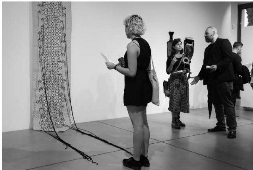
WIRELESS | Tkanina unikatowa dawniej i dziś (30.09–15.10)