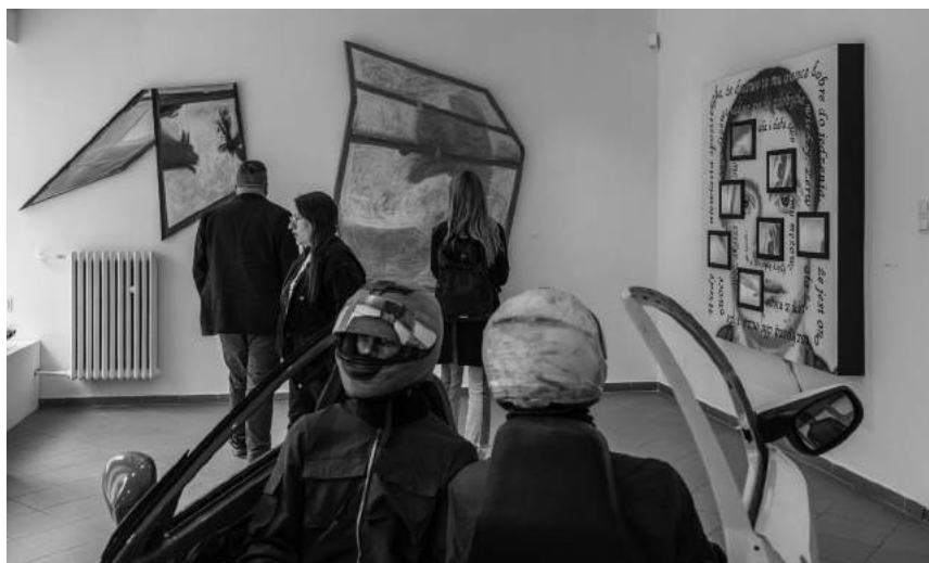
W ramach Rzeźby | REFLEKSY III (16–28.05.2023)