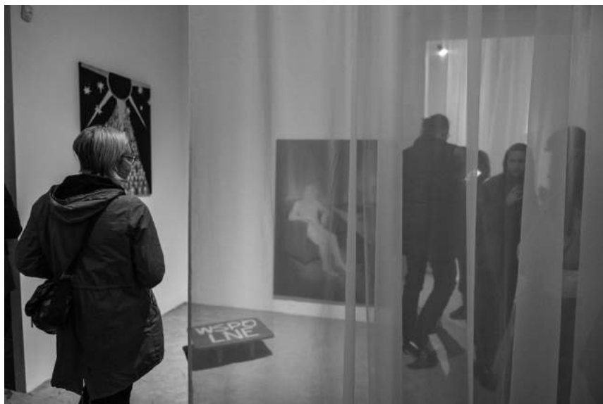
Budowanie ogrodu wokół płonącego domu (2–16.06), fot. Jadwiga Subczyńska