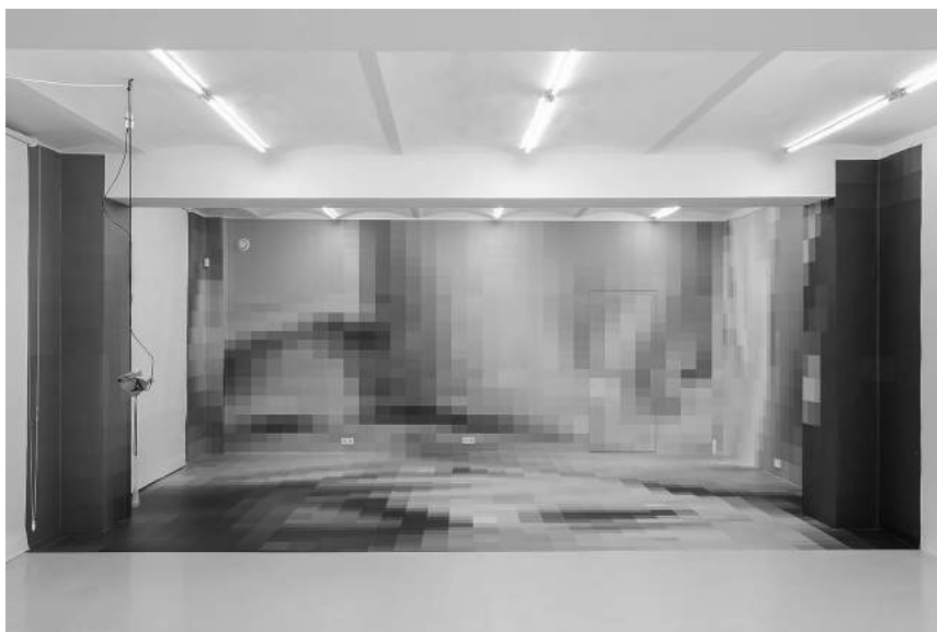
PIĘĆ NIECZYSTYCH ZADAŃ (31.03–21.04)