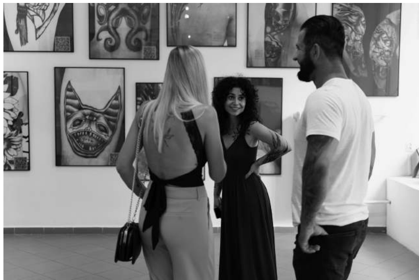
Tatuaż – forma sztuki (20.07–18.08), fot. Sonia Bober