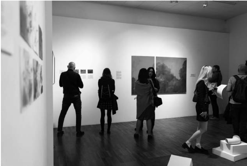
WIĘZI, KTÓRE WIAŻĄ / THE TIES THAT BIND (11–28.05)