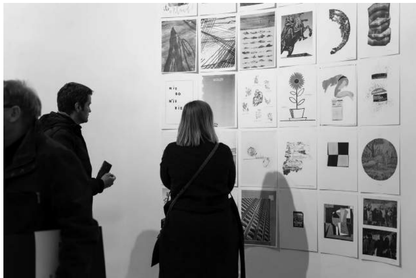
Risoteka / Risotheque (20–24.03)