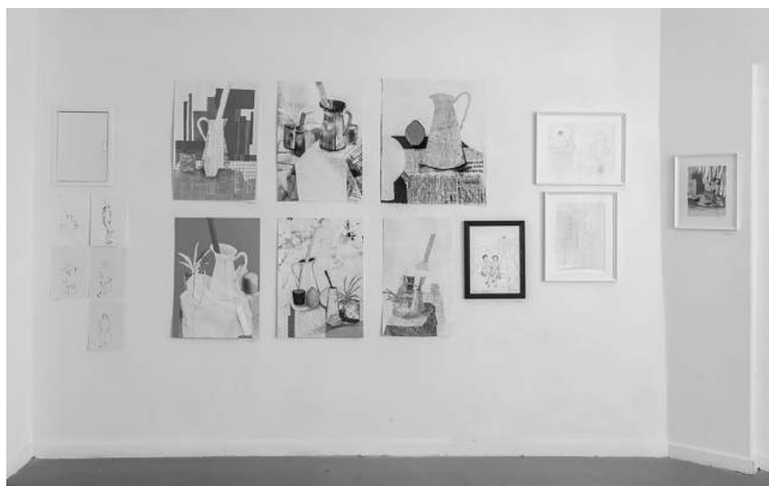
RYSUNEK (11–25.07) , Wystawy prac uczestników i uczestniczek Uniwersytetu Artystycznego III Wieku