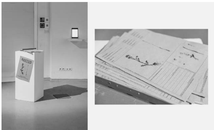
LET'S UNITE! (21–26.05.2023)