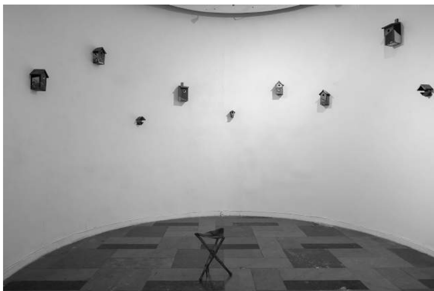
Malarskie domki dla sikorek , Grzegorz Ratajczyk (7–20.05)

Malarskie domki dla sikorek , Grzegorz Ratajczyk (7–20.05)