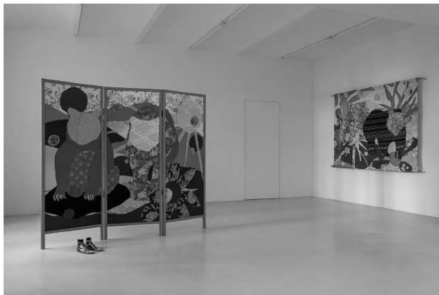
PIĘĆ NIECZYSTYCH ZADAŃ (31.03–21.04)