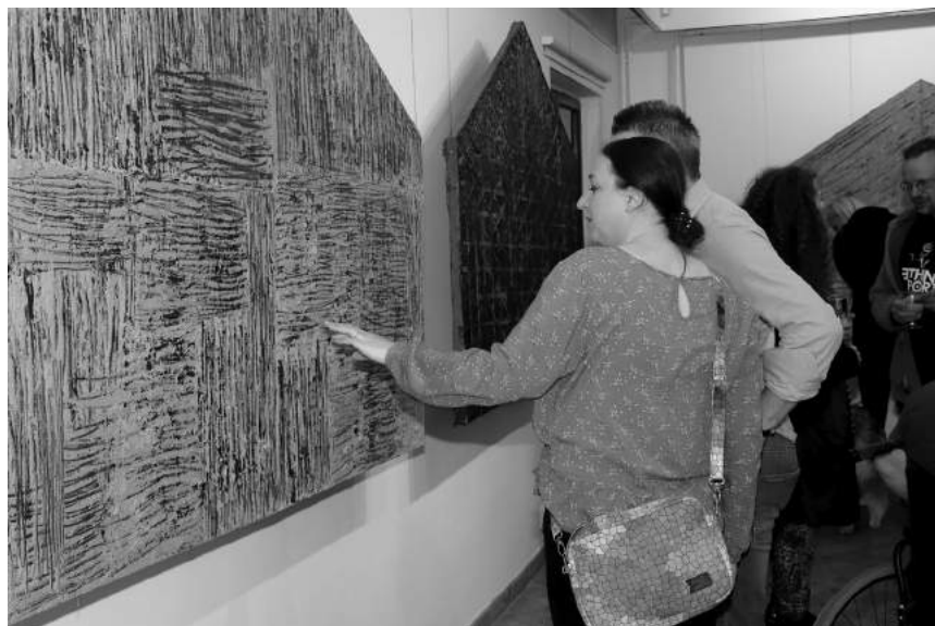
Domki, Tomasz Bukowski