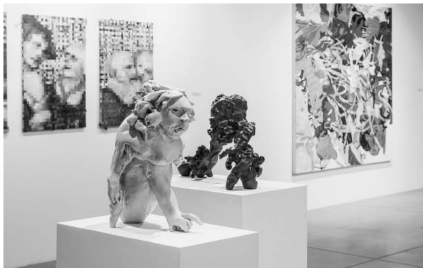
Krótkowzrocność (14–25.04)