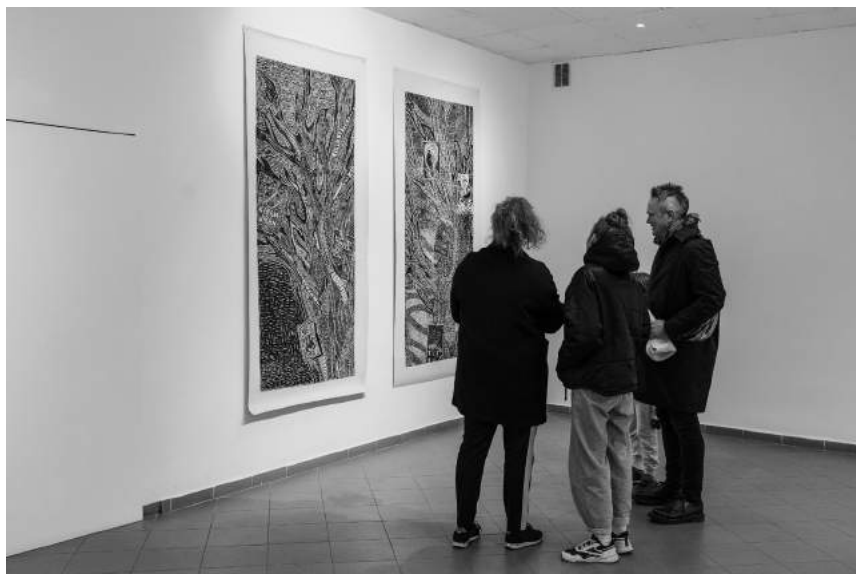
Gotong Royong (25.04–10.05)