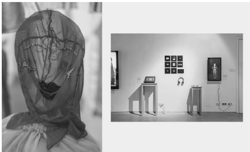
LET'S UNITE! (21–26.05.2023)