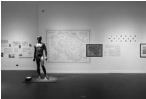
Il. 1. Wystawa Iluzje wszechwładzy. Architektura i codzienność pod okupacją niemiecką , Centrum Kultury ZAMEK w Poznaniu, fot. Tomasz Koszewnik

Warthegau w dalekosiężnych planach miał służyć jako wzór dla przyszłych terytoriów niemieckich sięgających daleko na wschód. Ta idea znalazła swoje odzwierciedlenie w planach miast i wsi, konkretnych budynków i ich wnętrzu, a także krajobrazów. Wśród nich docelowo miało funkcjonować społeczeństwo tworzące jednorodną etnicznie wspólnotę. Koncepty niemieckich dygnitarzy i służących im architektów były prezentowane miejscowej ludności za pośrednictwem prasy, radia i kina, rozpowszechniając tym samym iluzję wszechwładzy Rzeszy na nowo opanowanym terenie.