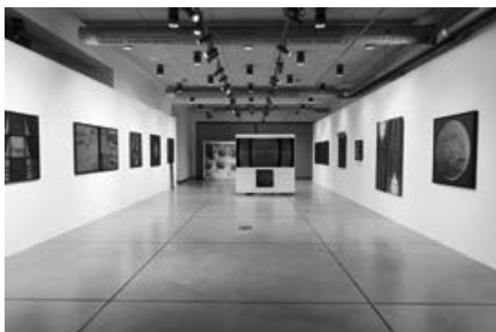
II. 2. Wystawa Andrzeja Banachowicza Obszary eksploracji w galerii Nowa Scena UAP, fot. Dział Promocji UAP